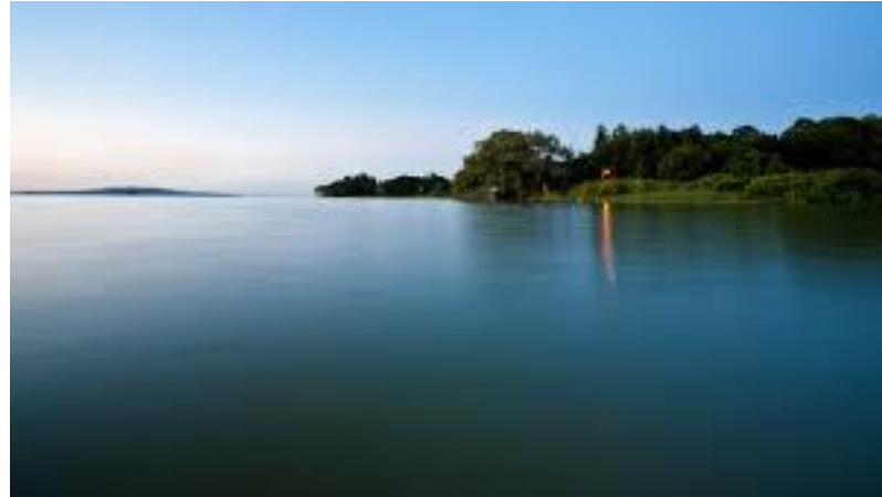
ሀይልም ሆነ 'መንግሥታዊ' ርብርብ አልነበረም።

ታላቁ ጣና በቀድሞው ሞገሱ፤ ታላቅ የሀገር ሀብትና የቱሪዝም መስብ የሆነው በጎጃም ባህርዳር የሚገኘው የጣና ሀይቅ በአረም ተውጦ እንዲጠፋ በአማራና መልክዐ ምድሩ ላይ በልዩ ልዩ መንገድ የዘመተው መሰረው ህወሃትና ተባባሪው የአማራው ክልል መንግሥት ብአዴን ጣናን በዝምታ አዝጋሚ ሞት እንዲሞት ከመሞከራቸው በፊት የታላቁ ጣና ሞገስና መስህብ እንዲህ ነበር።