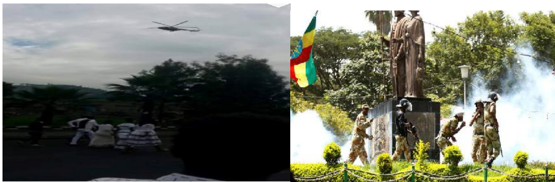
Police fire tear gas to disperse protesters during Irreecha, the thanks giving festival of the Oromo people in Bishoftu town of Oromia region, Ethiopia, October 2, 2016 በ2009 ዓ/ም ኢሬቻ ክብረ በዓል ላይ ደም የጠማው ህወሃት የላከው የጦር ሂሊኮፕተር በሆራ ሰማይ ላይ (የግራው ፎቶ)