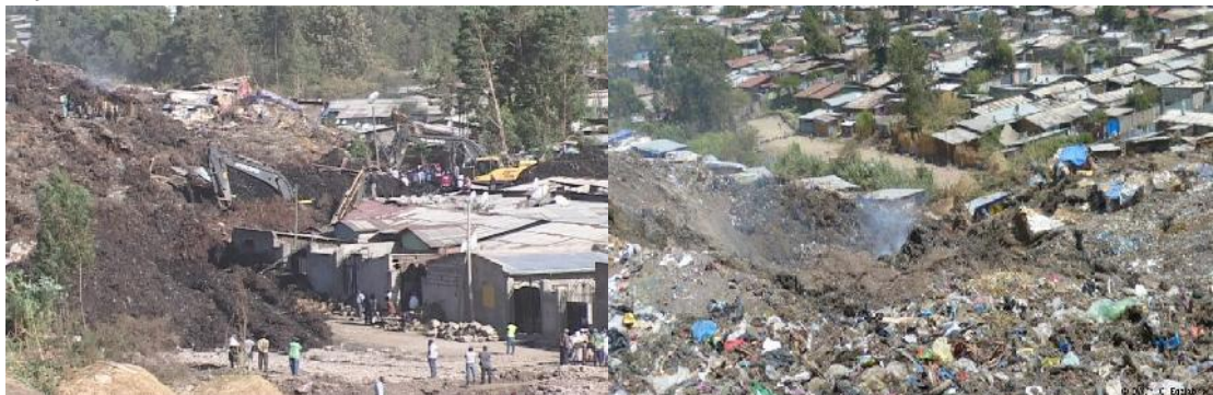
ቆሼ በከፊል። በቆሼ ተራራ ዙሪያ የሰፈሩት የአዲስ አበባ ጎስቋሎች መኖሪያ መንደሮች።

2009 ዓ/ም - ቆሼ፤- ወላድ ይፍረደን - የወላጆች ዋይታና ሀዘን። ኢትዮጵያና ህዝቦቿ በታሪካቸው አይተውት በማያውቁት የ11% እድገት አይደለም በአፍሪካ በዓለም ደረጃ ታይቶ የማይታወቅ ለውጥና የኑሮ መሻሻል ለህዝቡ አምጥቻለሁ በማለት በሚመገደቀው 'ልማታዊው' የህወሃት ወኪህ አዲስ አበባ ውስጥ በኮልሬ ቀራኒዮ ክፍለ ከተማ በተለምዶ "ቆሼ" እየተባለ በሚጠራው ሰፈር የቆሻሻ ተራራ ተደርጎሰባቸው ካለቁት በመቶ የሚቆጠሩ ኢትዮጵያውያን መኻል ሀዘንተኞች የያዙት ፎቶዎች እና የህዝብ ልቅሶ።