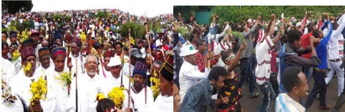
አብናቶች (አባት እናቶች) በኢሬቻ በዓል ቢሾፍቱ 2009 ዓ/ም PEOPLE MARCH IN BISHOFTU, ETHIOPIA, WHERE WITNESSES REPORT THAT SEVERAL DOZEN PEOPLE DIED IN A STAMPEDE DURING THE RELIGIOUS CELEBRATION OF IRRECHA.

ሲሆን ለኢትዮጵያ ጠላቶች ደግሞ ረመጥና መብረቅ! ወዮ ለወያኔ! ንሰሃ ገብታችሁ ገዳም መሄጃችሁ ዘመን አብቅቶ የፍርድ ቀን ቀርባለችና ወዮ ለናንተ ግፊኖች!!