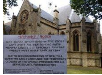
ወንድሙ መኩንን፣ አይልሰበሪ፣ እንግላንድ መጋቢት ፲፰ ቀን ፪ሺ፰ (26 March 2013) ዓ.ም.